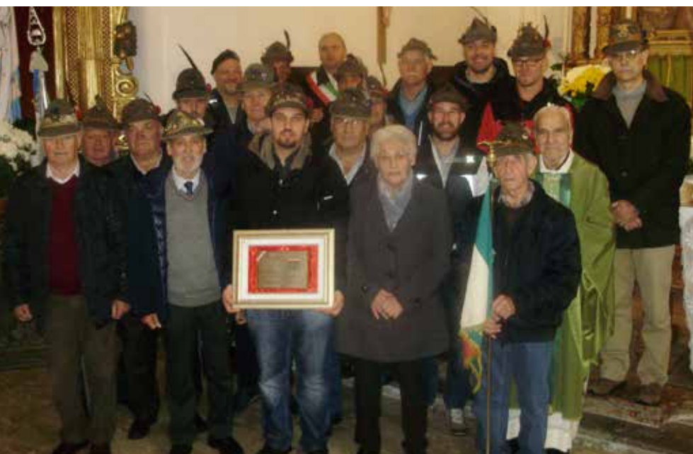
La targa consegnata ai familiari di Gramola.