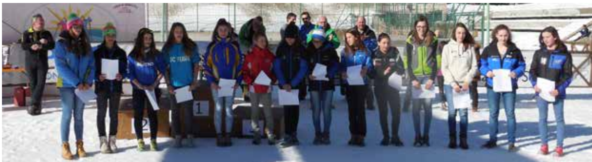
Categoria ragazzi femminile convocate alla premiazione dei Campionati Trentini Trofeo Enrico Cavallari del 21/02/2016.