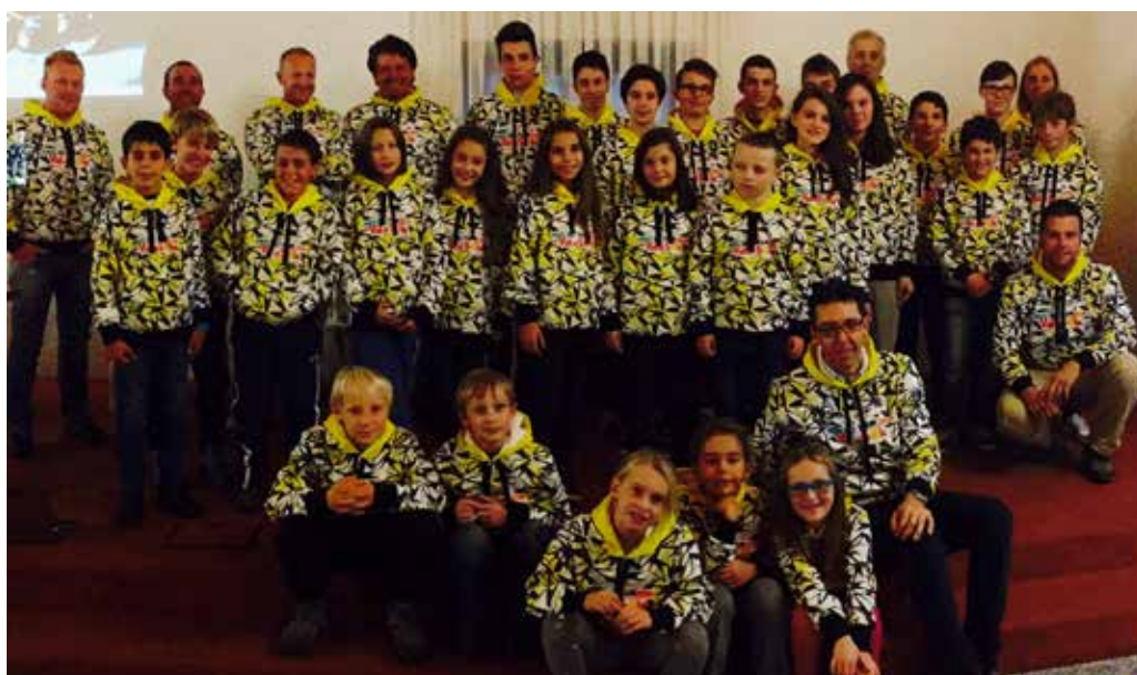
Una parte della squadra con la nuova felpa realizzata per la stagione 2016-17 che lo Ski Team ha regalato a tutti i suoi atleti!

La stagione sciistica è alle porte e lo Ski Team Val di Sole è pronto con tutti i suoi atleti e con un grande team di allenatori!