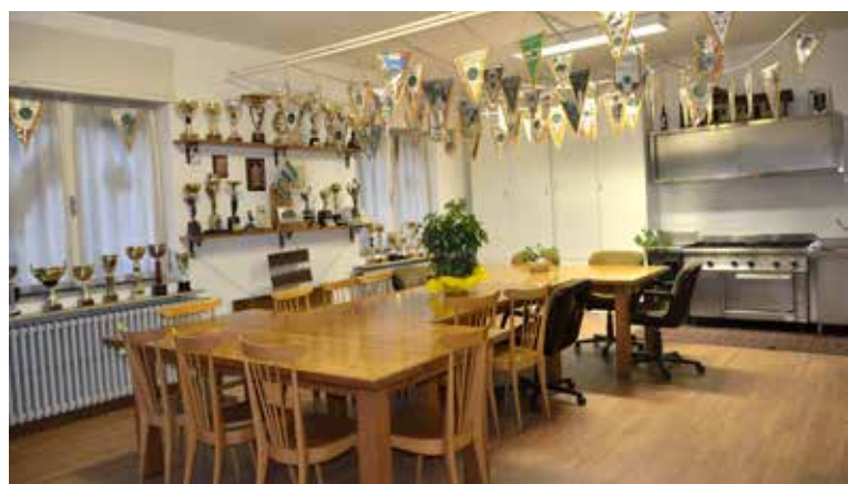
La sede degli Alpini.