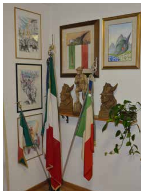
La sede degli Alpini.